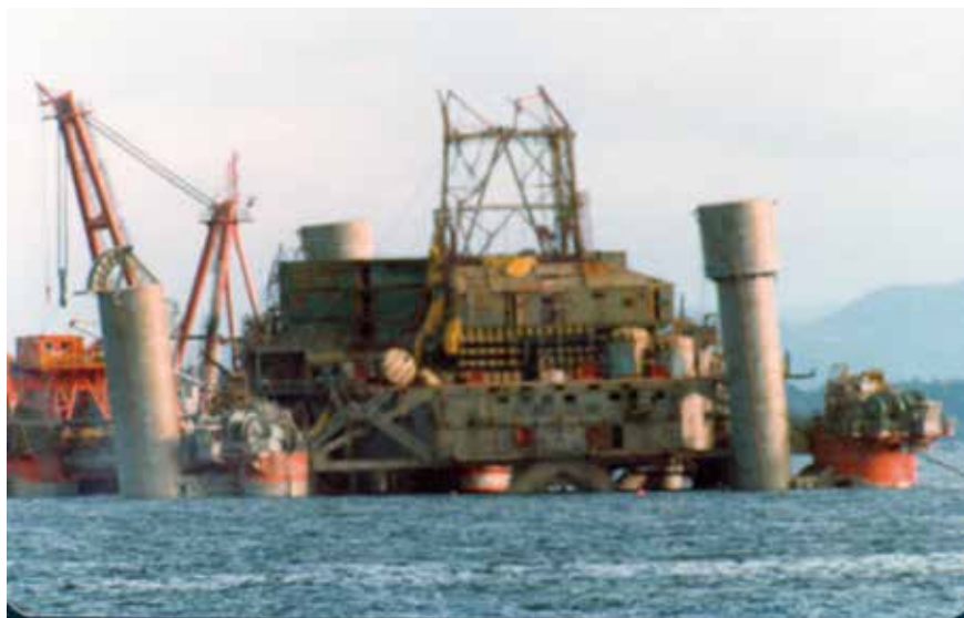
Alexander L. Kielland-plattformen i Gandsfjorden etter den var snudd.

I en felles fraksjonsmerknad uttalte Arbeiderpartiet og Høyre bl.a. at «Det har flere ganger vært foreslått å starte petroleumsvirksomhet nord for 62 grader N, og like mange ganger har tidspunktet blitt skjøvet fremover i tid. Det har særlig vært de mange praktiske og tekniske forberedelser for å gjøre sikkerheten god nok og oppbyggingen av en skikkelig beredskap, som har medført forskyvningene i starttidspunktet». Med henvisning til de «distriktpolitiske virkninger i landsdelen og ønsket om å få best mulig kjennskap til petroleumssressursene», uttalte de to partiene: «Således bør prøveboring etter olje og gass starte så snart dette er praktisk mulig og målsettingen om at virksomheten kan foregå innenfor et akseptabelt risikonivå er oppfylt. Så langt de sikkerhetsmessige forutsetninger ... oppfylles, vil det etter flertallets oppfatning være mulig å starte boringene i 1980 utenfor Nord-Norge og Midt-Norge».