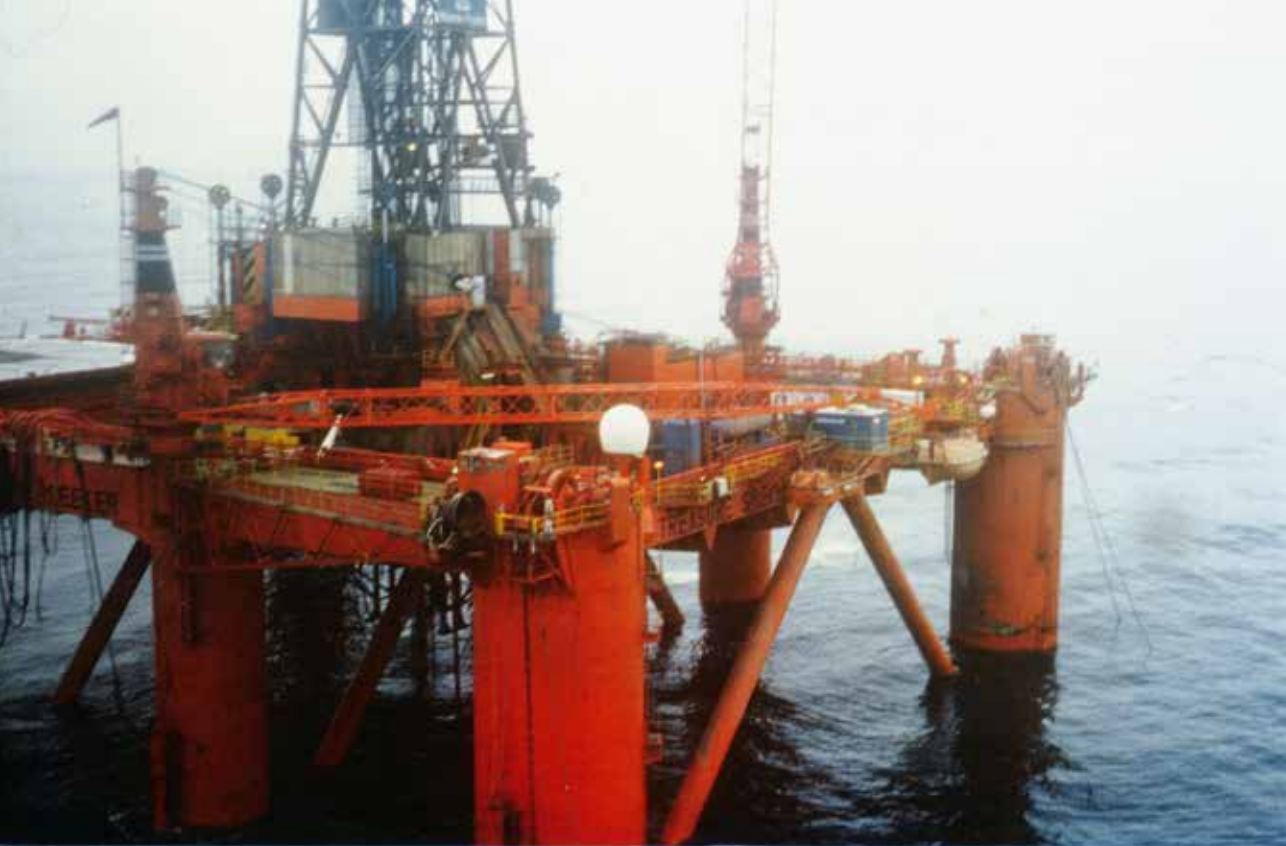
Treasure Seeker.

tre første blokkene delt ut. De norske selskapene Statoil, Hydro og Saga fikk operatøransvaret. Samtidig la Olje- og energidepartementet fram St.meld. nr. 46 (1979-80) med en ajourført redegjørelse om oljeboring nord for 62. breddegrad. Partiene inntok stort sett de samme standpunktene som før, og den 13. mars 1980 forkastet Stortinget med 76 mot 26 stemmer et forslag om å utsette prøveboringen nord for den 62. breddegrad.